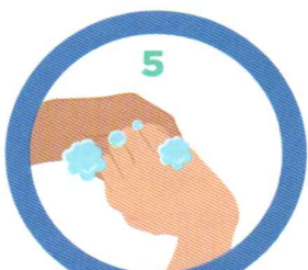
Az ujjak hátulja