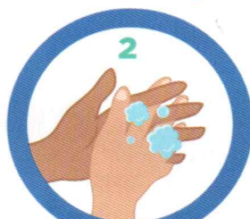
Az ujjak között