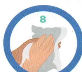
Öblítés és szárazra törülés

ZÖLD SZÁMOK: 06-80-277-455 és 06-80-277-456