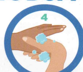
Az ujjak töve